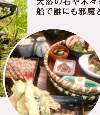
◀館内の創作和食レストラン「志楽亭」では、本格的な蕎麦（十割または石臼挽）や日本各地の銘酒を味わえます